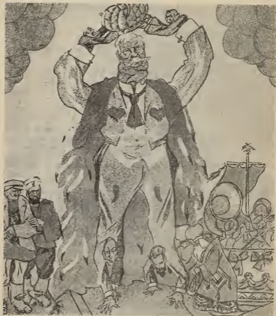
Рис. Д. Моора.